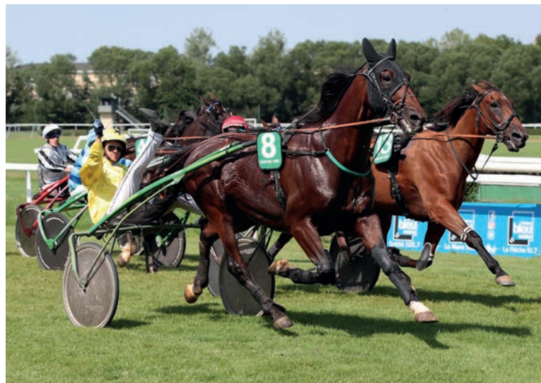
Derby du Dollar doit s'imposer dimanche pour croire en la victoire finale.