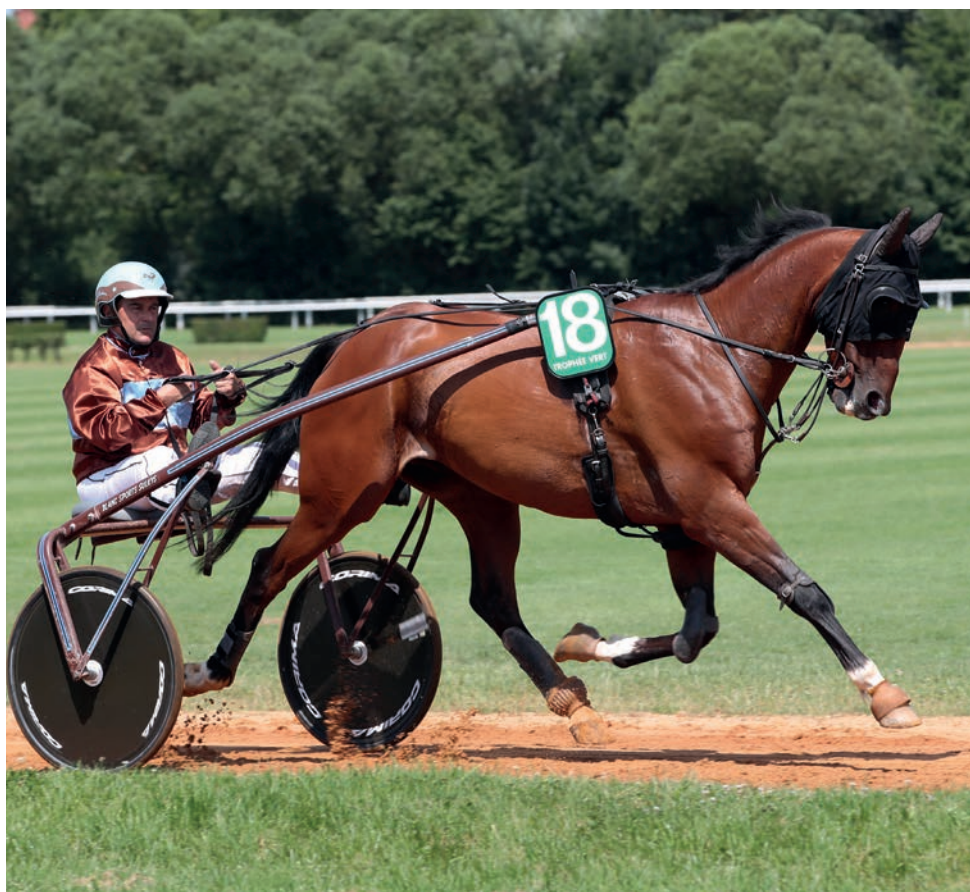
Blues des Landiers poursuit sa marche en avant dans le Trophée Vert 2019.